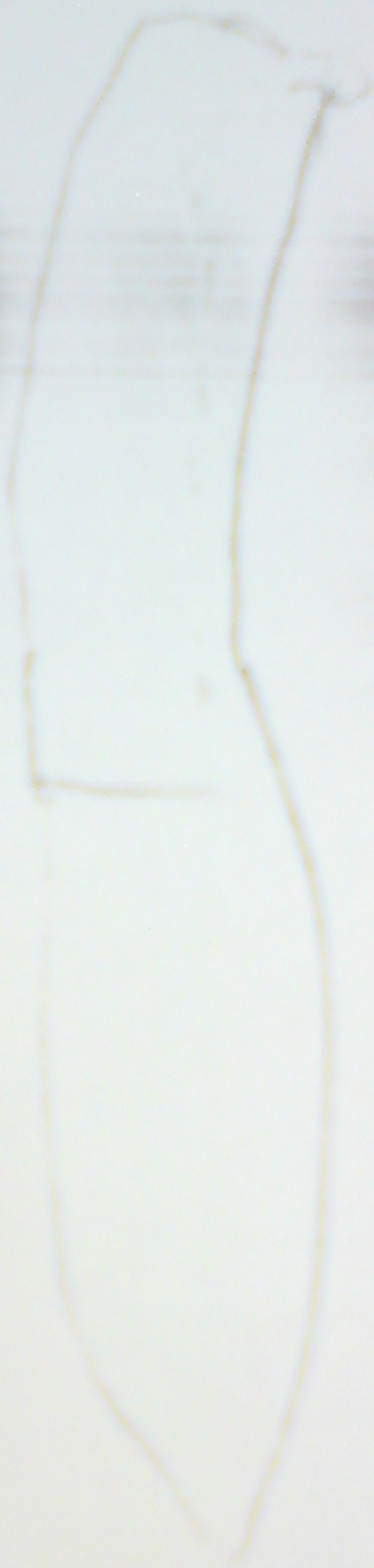
Рисунок юбки, который демонстрировал